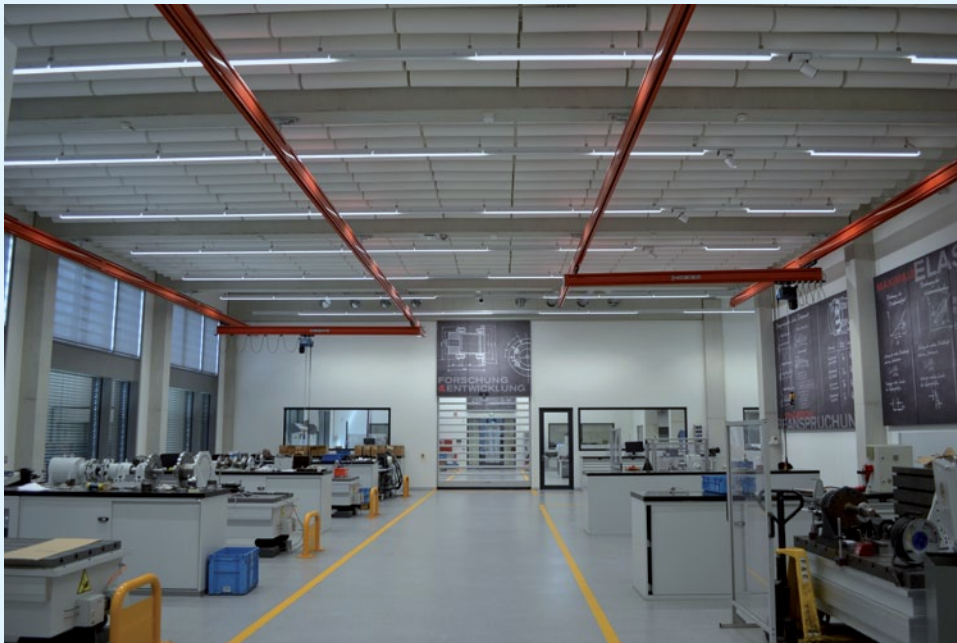
F&E-Zentrum nach dem Einbau der Absorber