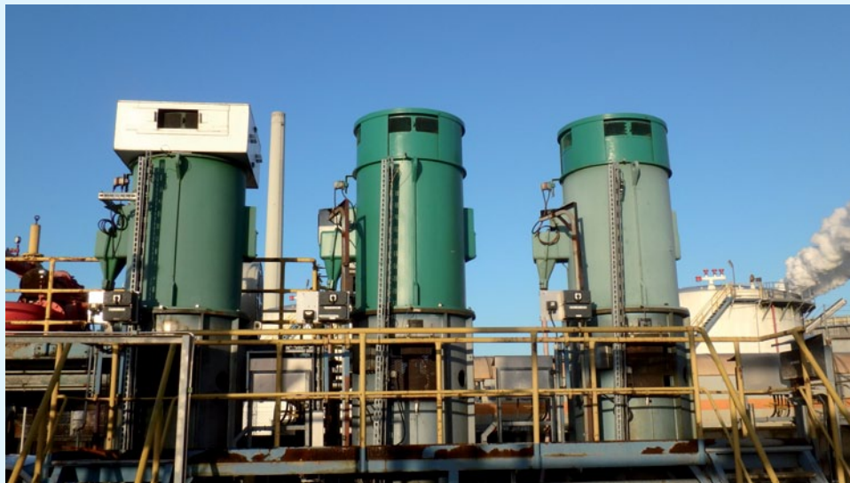
Kühlwasserpumpen 1 und 2 (rechts) mit „Stahlring“-Aufsatz als zusätzliche schwingende Masse am oberen Ende der E-Motoren