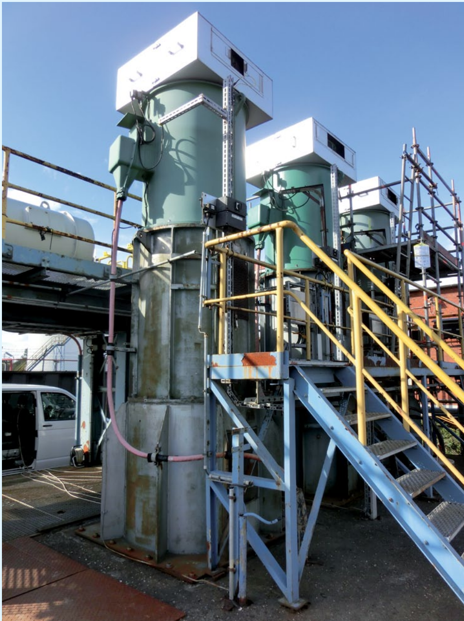
Kühlwasserpumpenanlage: Drei nebeneinander aufgestellte baugleiche Vertikalpumpen